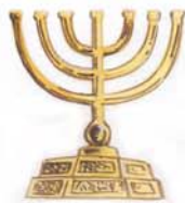
candelābrum -ī n