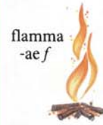
flamma -ae f

dēlēre -ēvisse -ētum = absūmere, perdere tēctum : domus vestīgium : quod reli- quum est