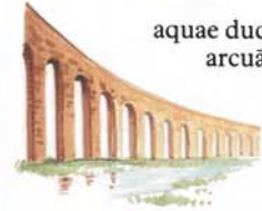
aquae ductus arcuātus