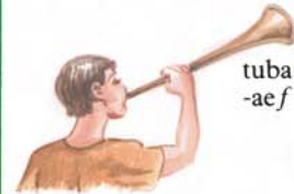
tuba -ae f